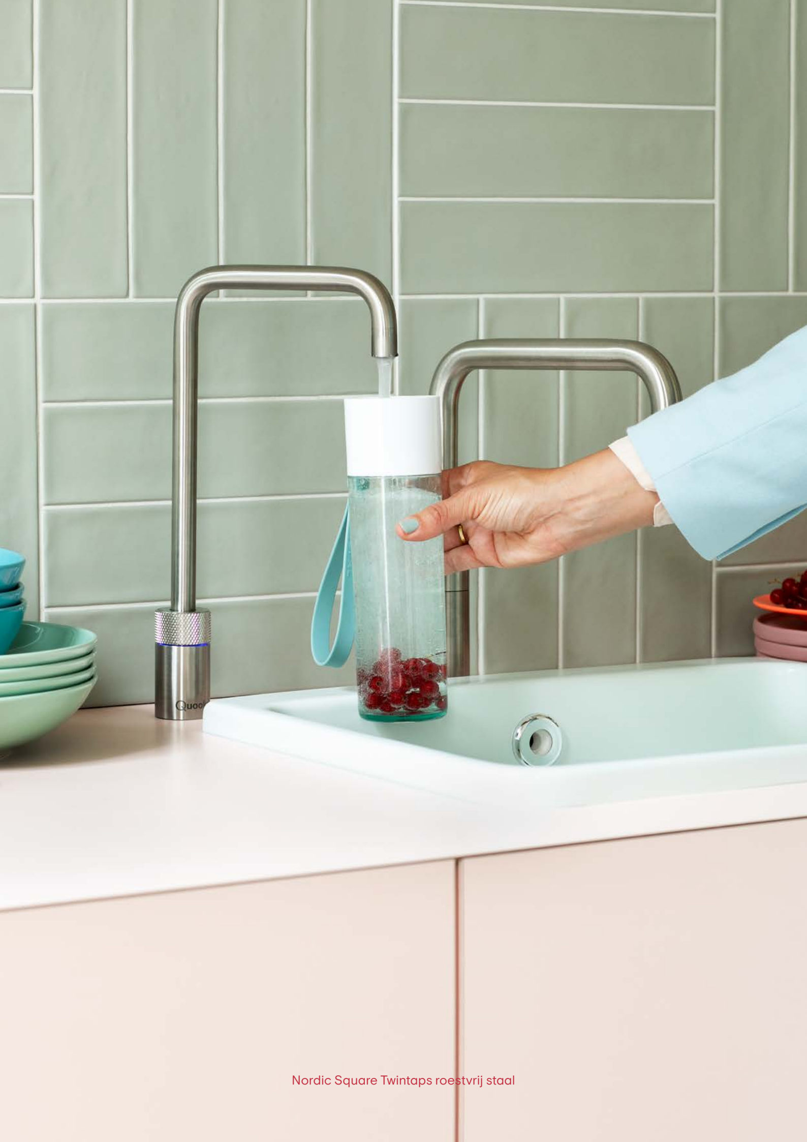
Nordic Square Twintaps roestvrij staal