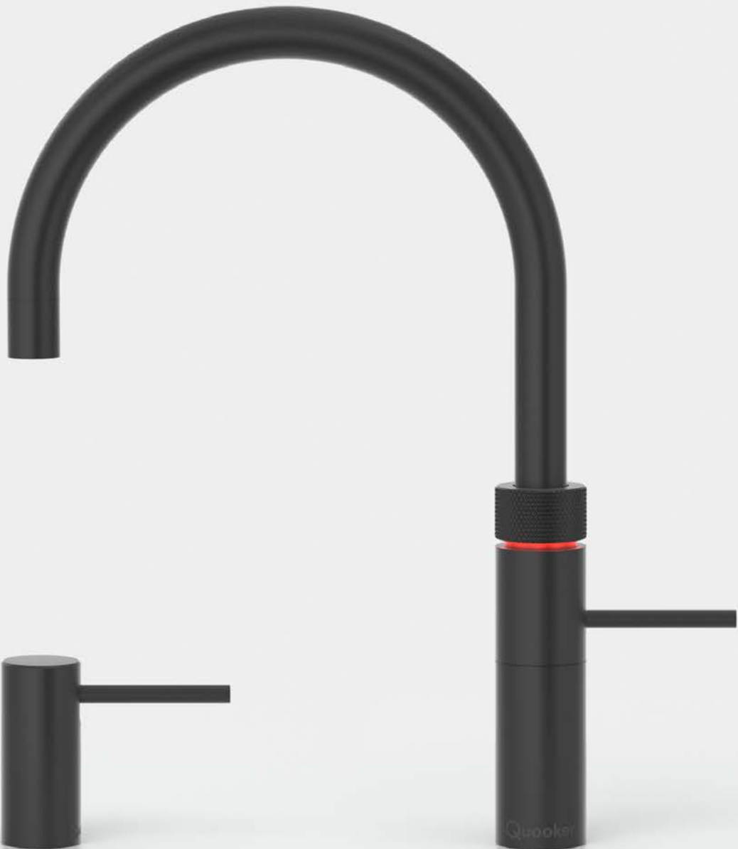
Nordic zeppomp zwart