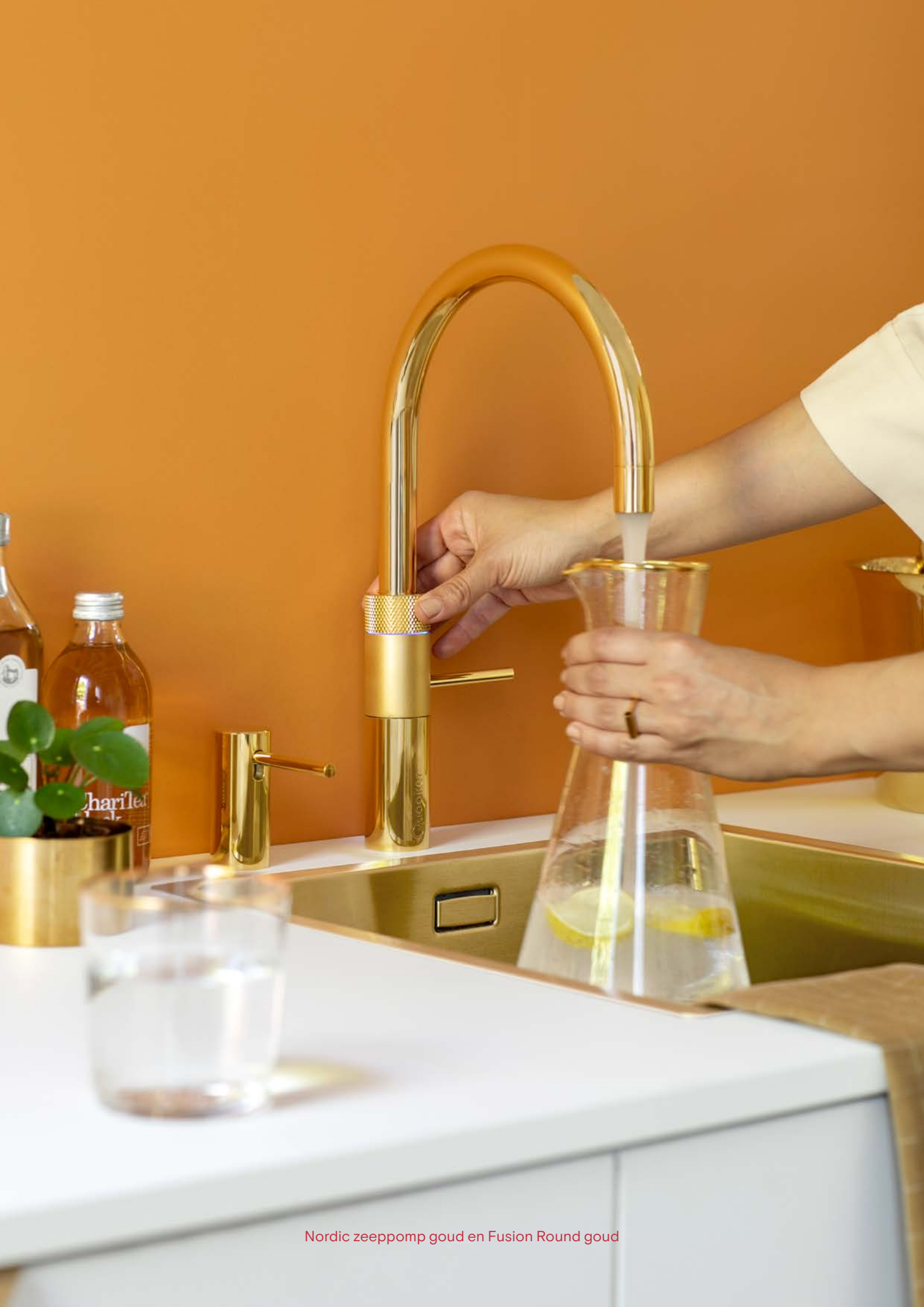
Nordic zeppomp goud en Fusion Round goud