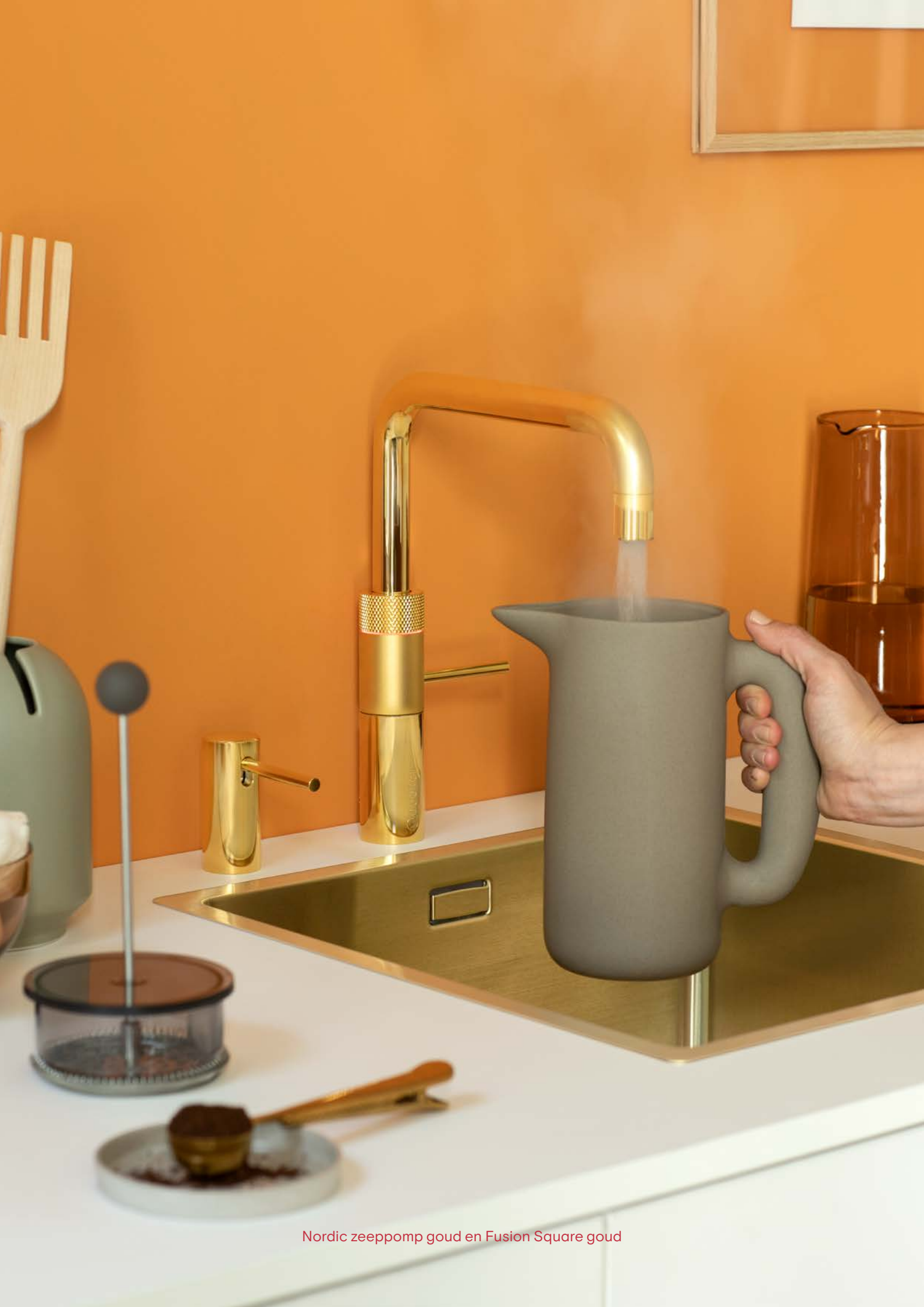
Nordic zeppomp goud en Fusion Square goud