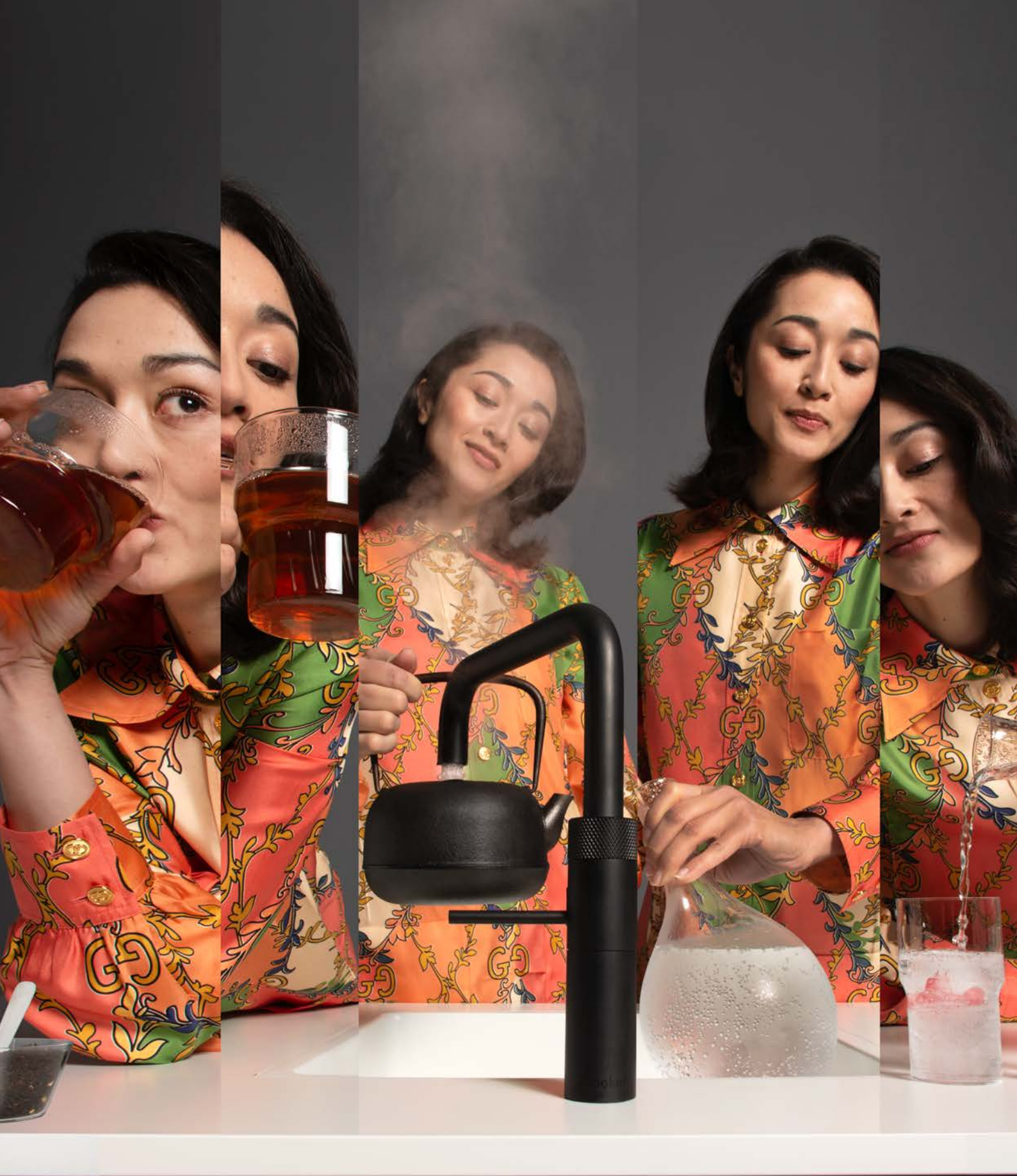
Fusion Square zwart