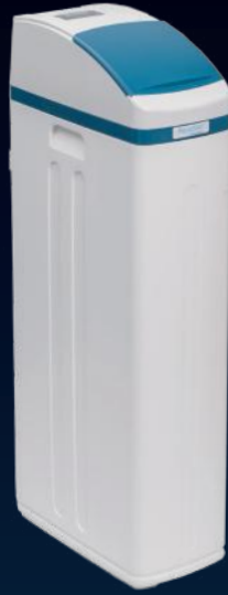
1400 SHE Plus