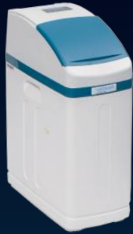
800 SHE Plus