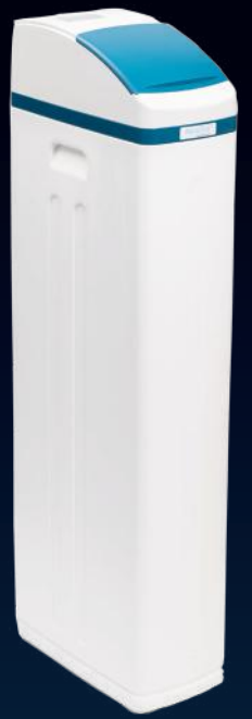
2000 SHE Plus